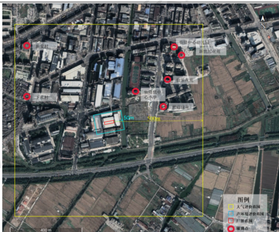
图 3-1 环境保护目标示意图