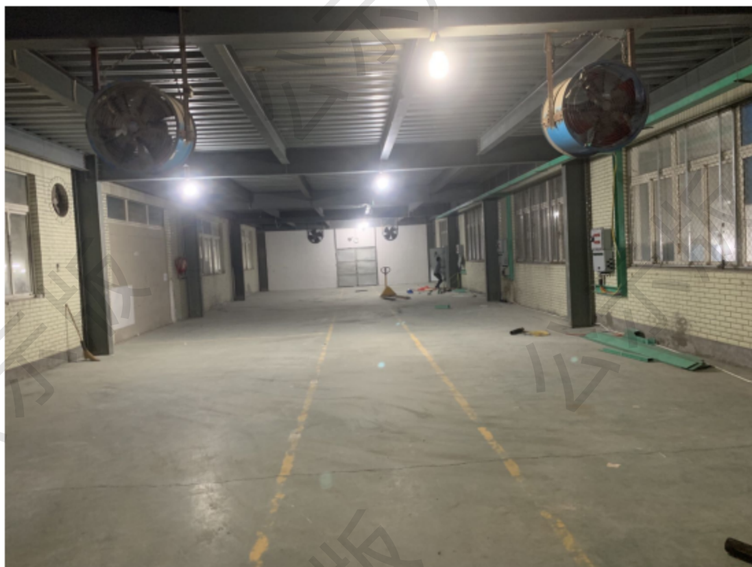
图 2-3 项目车间现状图